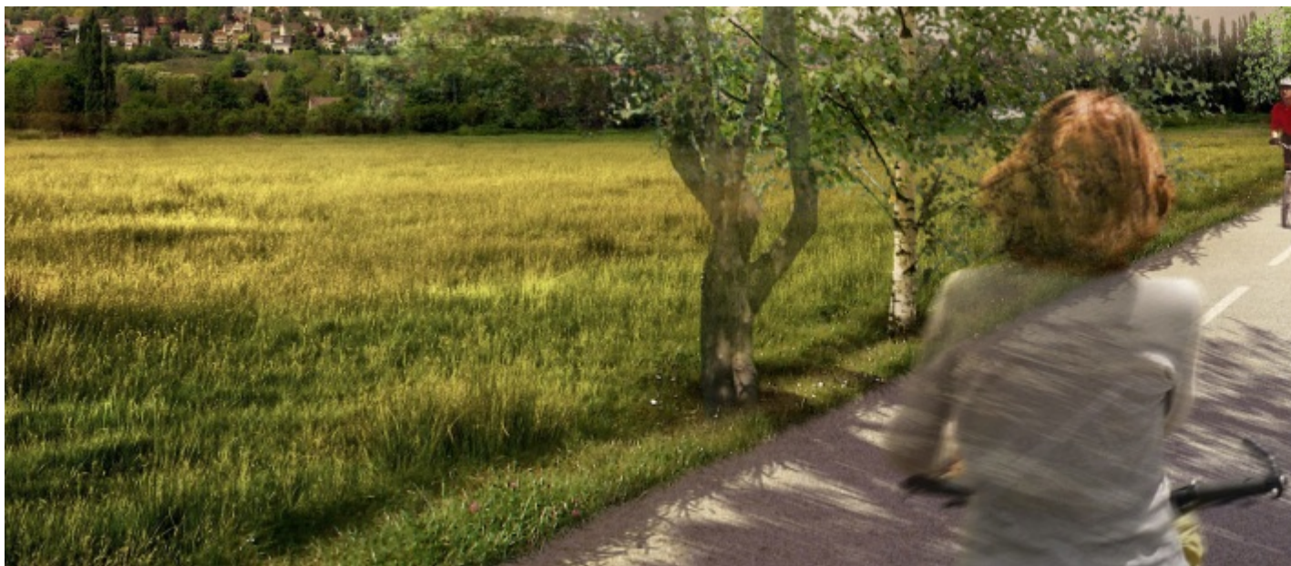
Vue de la Route du Barrage en 2040 (perspective d'architecte)