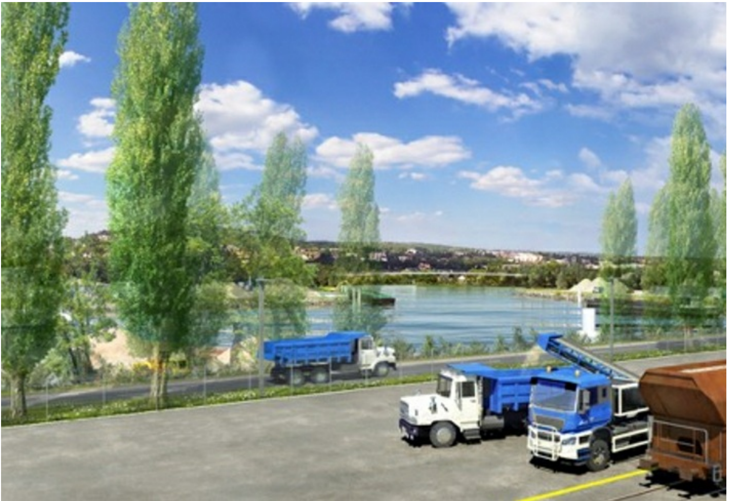
Vue des voies ferroviaires de PSMO en 2040 (perspective d'architecte)