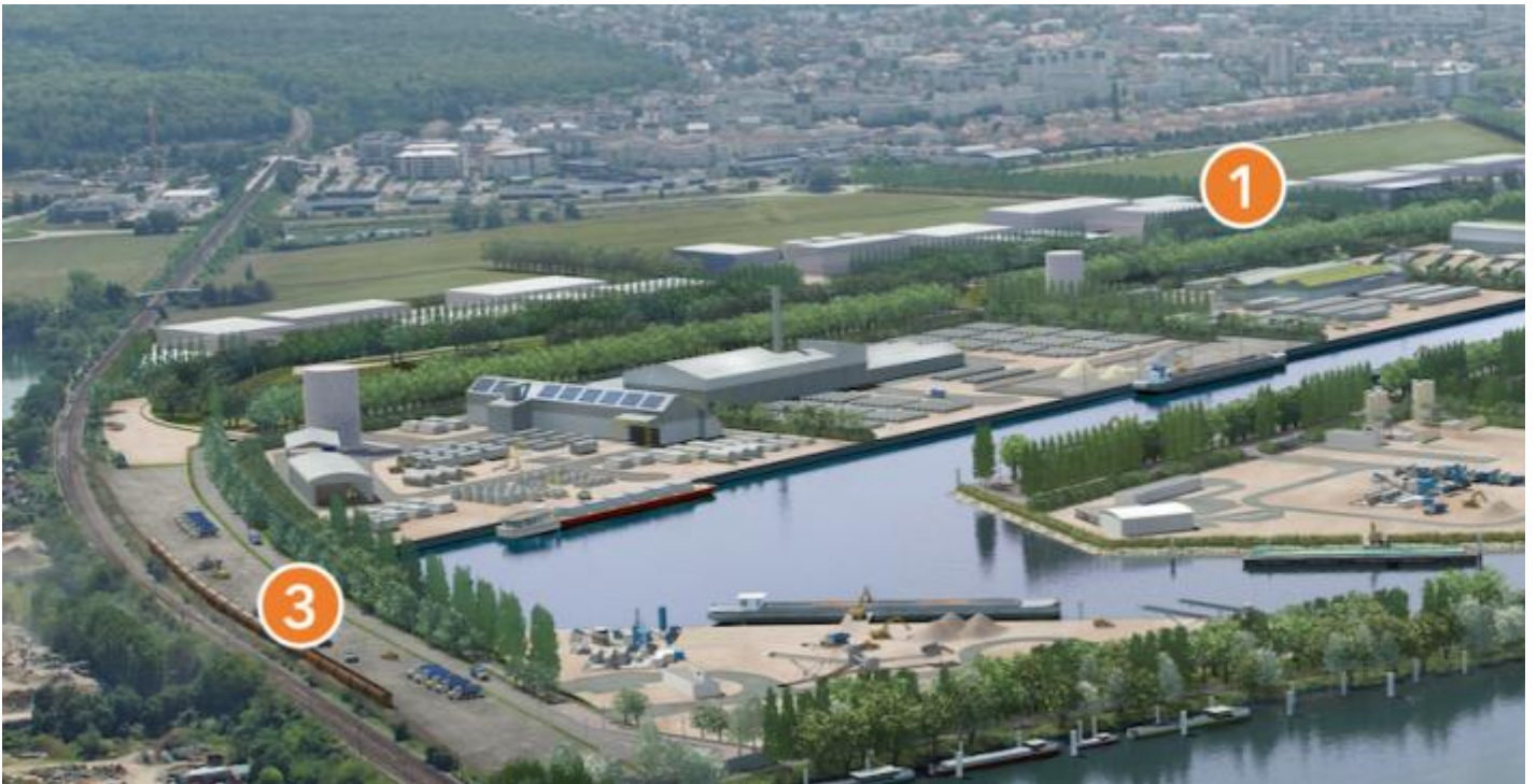
Vue de PSMO en 2040 (perspective d'architecte)