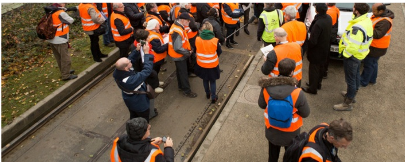
Visite de terrain sur le port de Bonneuil-sur-Marne, dans le cadre de la concertation post débat public

Chaque année de concertation a été mis à contribution pour approfondir un axe du projet :