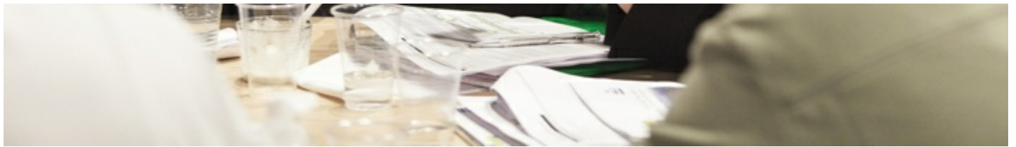
Atelier P6 du 25/04/2017, à Andrésy, source HAROPA – Ports de Paris