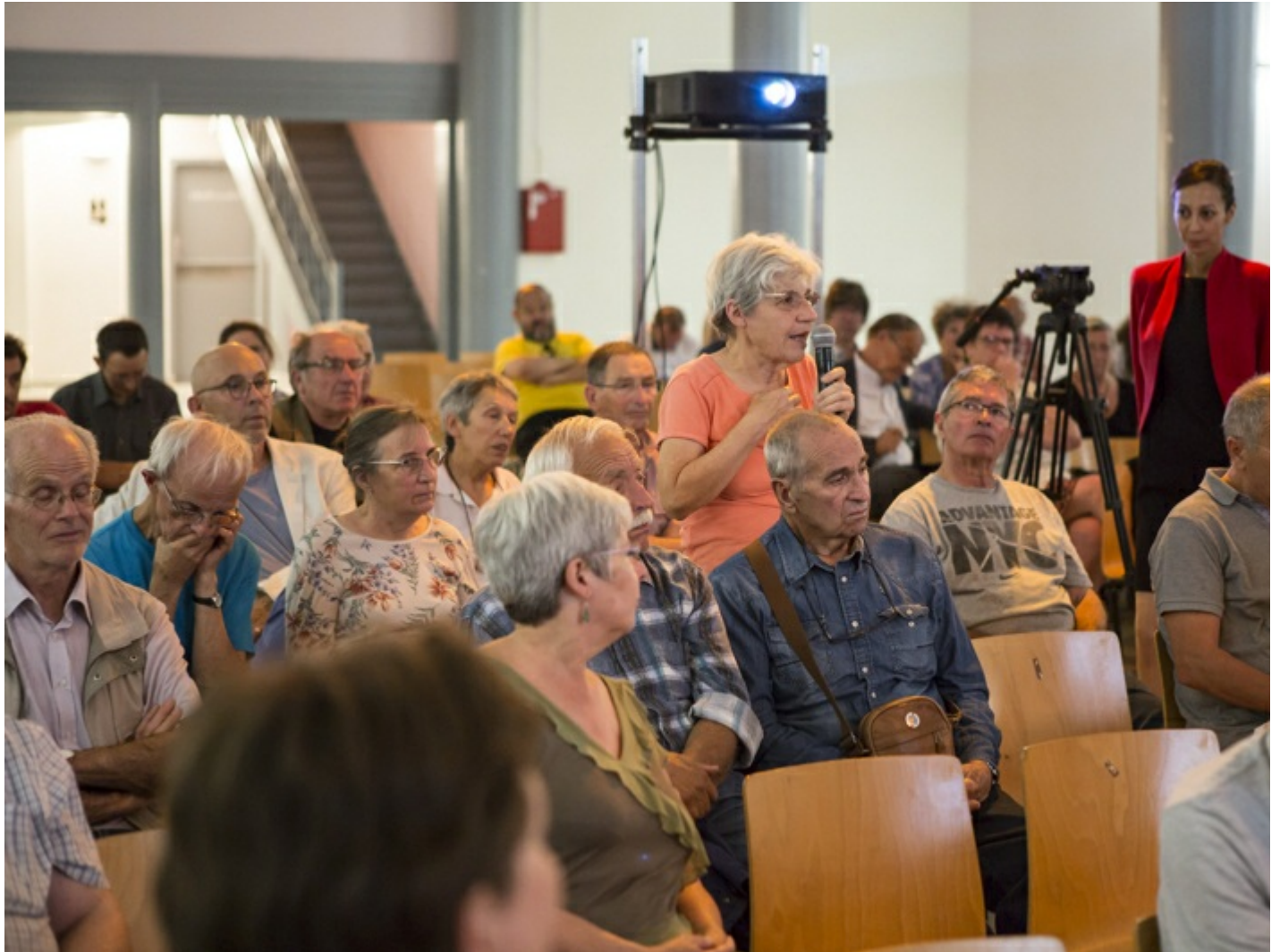
Réunion publique n°3 du 11/09/2018 à Conflans-Sainte-Honorine

Le dispositif de la concertation reposait sur un cadre formel :